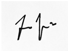
Jos van Rijsingen, voorzitter VVG-PGB Ook te volgen op twitter: @JosvRijsingen

De discussies over koopkracht en pensioenen hebben de nodige raakvlakken. Het is ingewikkeld en politici en deskundigen ventileren de meest tegenstrijdige verhalen. De wantrouwige burgers kan er geen wijs uit. Toch hoop ik niet dat we het hoofd in de moede schoot leggen en op 20 maart thuis blijven. Probeer desnoods op één of enkele onderwerpen (provinciaal of landelijk) te bepalen welke partij het beste en reële perspectief biedt en laat dat leidend zijn in het stemhokje.